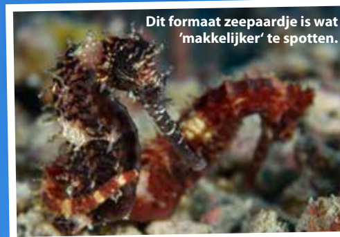
Dit formaat zeepaardje is wat 'makkelijker' te spotten.