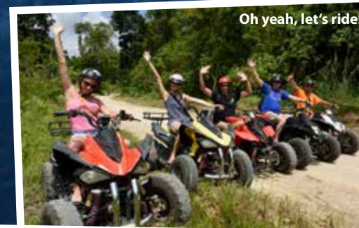
Oh yeah, let's ride!