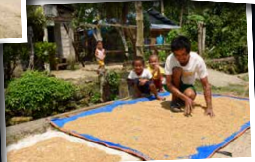
Rijst ligt te drogen in de zon.