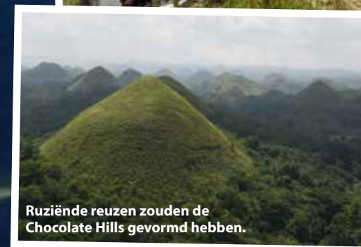
Ruziënde reuzen zouden de Chocolate Hills gevormd hebben.