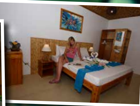
Je waant je direct in het paradijs bij Magic Oceans. Wat een ruimte en luxe!