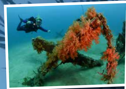
Op de kale zandvlakte staan grote kruisfiguren die als kunstmatig rif dienen.

We duiken meerdere dagen op Bohol, maar de rest bewaren we voor een volgende keer. Wat hebben we genoten deze dagen, zowel mijn moeder als ik. Het is een geweldige reis voor duikers met hun niet-duikende partner of familieleden. Natuurschoon, helder water, schitterend onderwaterleven en een geweldig resort om te verblijven... Om dan nog maar te zwijgen over het heerlijke eten (ik moet zeker dat recept van de mango cheesecake hebben!) en de superlieve mensen. Inderdaad. It's a kind of magic.