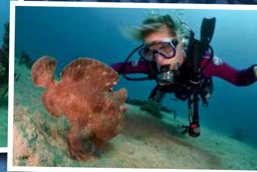
Wiebelend en waggelend loopt de hengelaarsvis richting zijn huis.