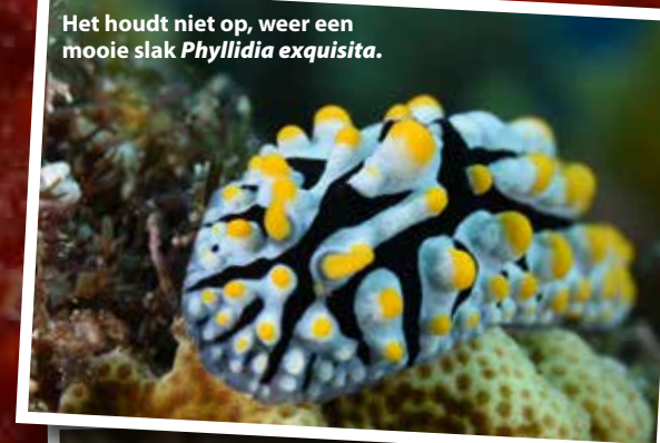
Het houdt niet op, weer een mooie slak Phyllidia exquisita .

Ik klim aan boord en ik ruik de verse mango al. Tussen de duiken door krijg je heerlijk zoet fruit voorgeschoteld, vers verkregen van eigen bodem. Mijn moeder is ook al aan boord en neemt net een slok warme thee. Haar haren zijn nat en ze begint direct te vertellen over haar snorkelavontuur. Ze duikt niet, maar ze gaat altijd mee als wij kopje onder gaan en verkent dan de ondiepere gedeeltes. Ik ben helemaal verbaasd als ze me vertelt dat ze ook een zeenaaktslak heeft gezien. Tenminste, dat denkt ze. Ik acht de kans vrij hoog in ieder