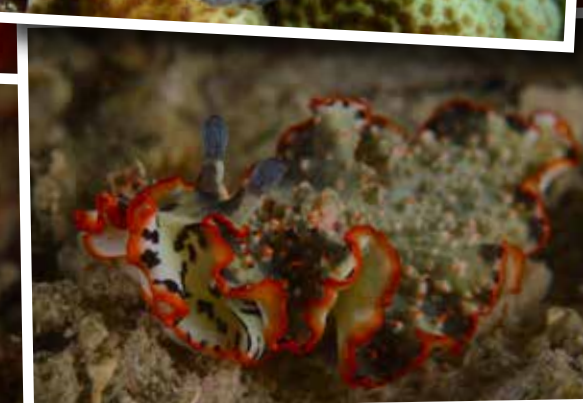
En nog een! De Dermatobranchus ornatus .