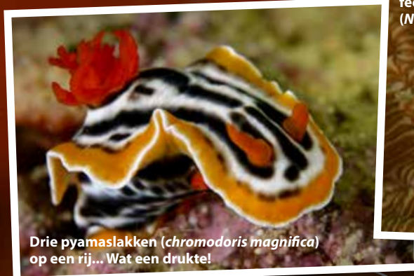
Drie pyamaslakken ( chromodoris magnifica ) op een rij... Wat een drukte!