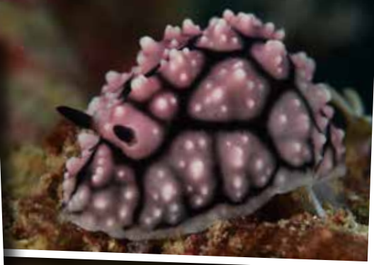
Echt of nep? De Phyllidiella pustulosa is wel een heel eigenaardige verschijning.

Gelukkig, ook nog een blauwe slak ( Thuridilla lineolata ), die hadden we nog niet.