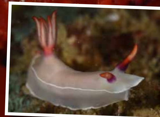
Hypselodoris bullocki is herkenbaar aan de witte streep die langs zijn zij loopt.