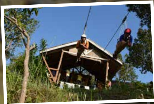
Het zweet staat in mijn handen, maar er is geen weg meer terug... We gaan!

We zweven nog even verder, maar dit keer onder water. 'Voor de deur rechts' bij Magic Oceans Dive resort ligt een schitterend rif, Coral Garden. We kennen de stek al, maar we willen onze laatste duik ook graag hier maken. Het water is kraakhelder. We zwemmen richting de diepe drop-off en het is adembenemend om te zien wat er allemaal groeit. Zoveel soorten koralen, de een nog kleurrijker en artistieker dan de ander. De wand loopt steil naar beneden en overal valt wel wat te ontdekken. In de diepe scheuren vind ik vele soorten sponzen, van knalgeel tot bloedrood. En doordat er zoveel groeit, is er natuurlijk ook veel vis in en op het rif te vinden. Papegaaivissen, Nemo's, allerlei soorten dokters- en vlindervissen... Een fantastische afsluiting. En mijn moeder? Zij is ook alweer aan het snorkelen. Ze geeft wederom een enthousiast OK-teken en maakt een handsignaal van iets dat ik niet gezien heb... Een schildpad.