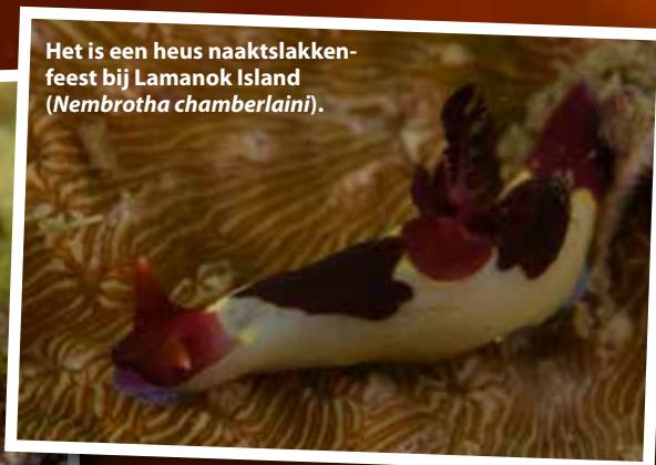
Het is een heus naaktslakkenfeest bij Lamanok Island ( Nembrotha chamberlaini ).